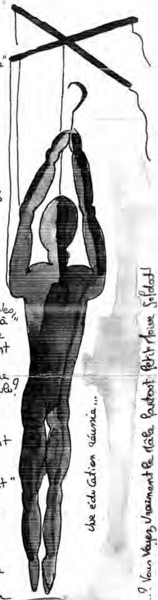
Une échelation éternelle...

Une analyse polémique? Vous voyez vraiment le rôle partout petit monde solidat