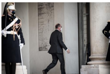
Fin du conseil des ministres, mercredi 9 décembre 2020.

Le projet de loi « confortant les principes républicains », selon sa nouvelle appellation, a été adopté mercredi en conseil des ministres. Sans la citer, il vise « une idéologie politique qui s'appelle l'islamisme radical », revendique Jean Castex. Mediapart le décrypte, mesure par mesure. Avec les ajustements dus aux réserves du Conseil d'État.